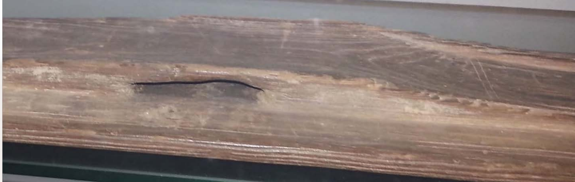
Päläs Vaalan Enonlahden muinaissuksesta.