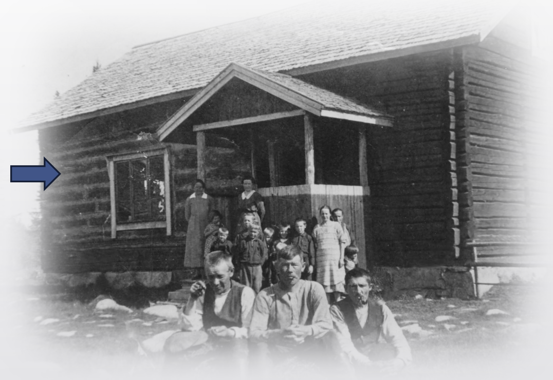
Eklundien raivaajaperhe 1930-luvun alussa. Talosta osa oli rakennettu turpeesta.