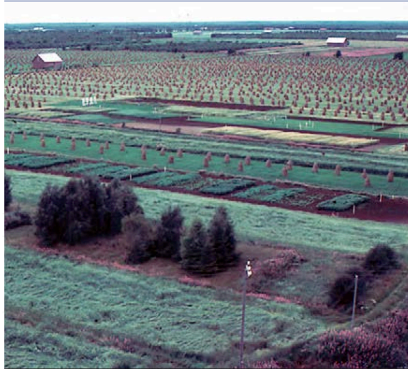
Pelson viljelyksiä 1980-luvulla. Valokuva yksit. kok.

Oulussa, B. B. Bergdahlin kirjapainossa, 1888.