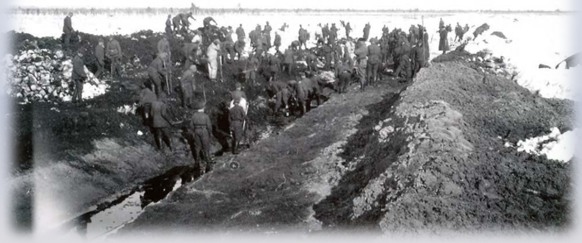
Valokuva yksit. kok.