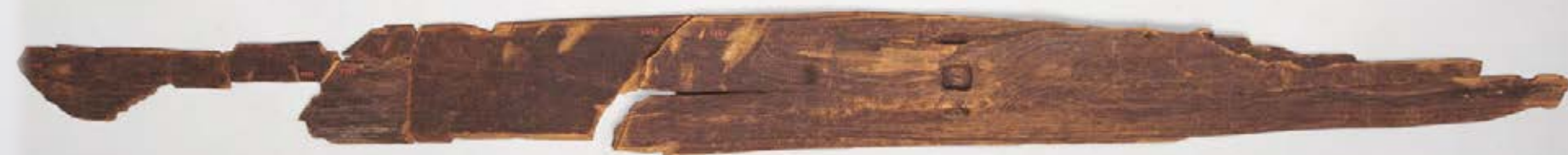
Sallan muinaissuksi. Noin 5 200 vuotta vanha suksi löytyi vuonna 1938.