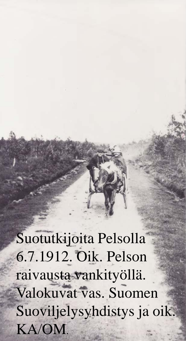
Suotutkijoita Pelsolla 6.7.1912. Oik. Pelson raivausta vankityöllä.